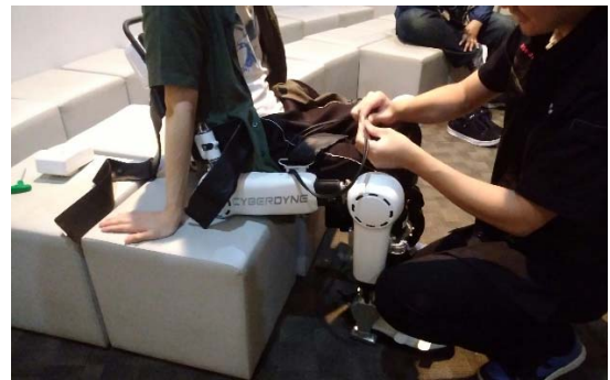
図 1 HAL を実際に装着した写真(接続)

脳からの神経伝達電気信号を読み取り、機器を動作させるスイッチとして利用するものに、株式会社 CYBERDYNE の HAL (Hybrid Assistive Limb) という身体機能を改善・補助・拡張・再生するシステムがある。世界初のサイボーグ型ロボットである。身体に HAL を装着することで、「人」「機械」「情報」を融合させ、身体の不自由な方をアシストしたり、いつもより大きなチカラを出したり、さらに、脳・神経系への運動学習を促すシステムである[1]。